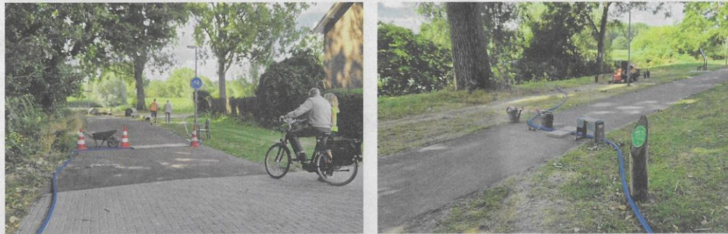
Vrijwilligers hielden de wacht bij de waterslang over het Aart Alblaspad, die met pilonnen en afzetlint beveiligd was.

De aanhoudende droogte zorgde begin augustus voor grote drukte bij Moestuin de Terp. Al het regenwater dat via de daken van het clubgebouw, het kippenhok en bijenhok naar beneden komt, stroomt rechtstreeks in de vijf watersilo's die de moestuin rijk is, elk met een capaciteit van duizend liter. Maar als gevolg van de aanhoudende droogte stonden alle silo's inmiddels droog, en dus verzamelde een grote groep vrijwilligers zich voor " Operatie pompen of verdrogen ;