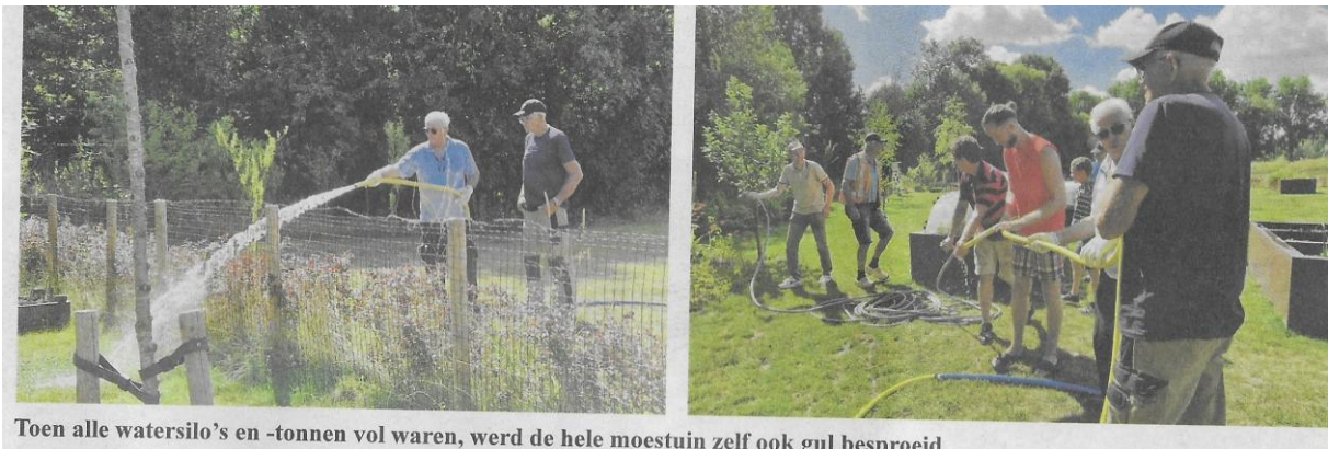
Toen alle watersilo's en -tonnen vol waren, werd de hele moestuin zelf ook gul besproeid.

Maar die paar maanden sinds de laatste zware regenbui waren inmiddels ruim voorbij, en de bodem van alle silo's was in zicht, terwijl de droogte volgens voorspelling nog lang niet voorbij was.