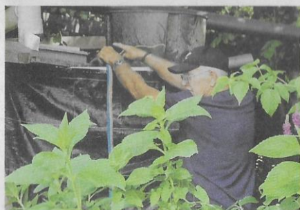
De silo's, tonnen en emmers werden tot de nok gevuld met water uit het Wantij.